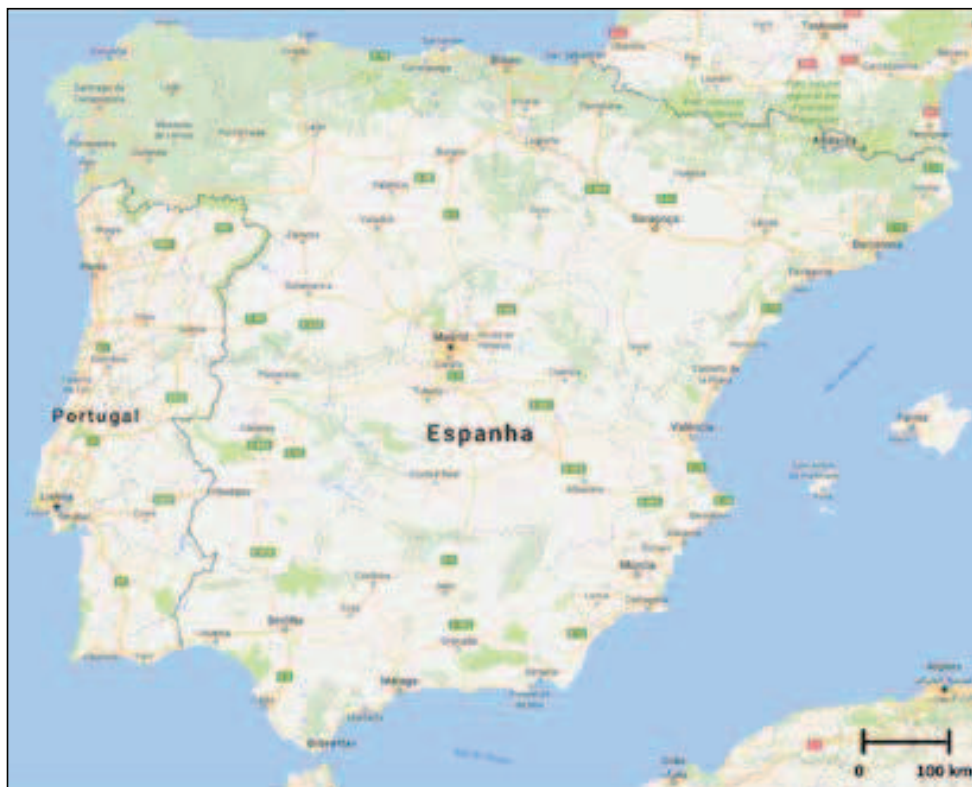
Figura 1 – A Península Ibérica e a fronteira terrestre que separa os territórios continentais de Portugal e Espanha (adaptado a partir de Google Maps).

Com uma extensão de 1215 km - 339 km a norte e 876 km a leste (Daveau, 1976), o traçado da atual fronteira terrestre entre Portugal Continental e Espanha é herdeiro da Reconquista Cristã e ficou, em grande parte, estabilizado depois do Tratado de Alcanizes, assinado pelos dois países ibéricos em 1297. Com a exceção de um troço com 63 km de extensão- entre a foz do rio Caia e a Ribeira de Cuncos (Figura 2), trata-se de uma demarcação política bilateral, isto é, aceite por ambas as partes, com uma estabilidade que se compreende, entre outros fatores, pela distância deste território face aos focos de maior imprevisibilidade e turbulência política mais frequentes no centro do continente europeu.