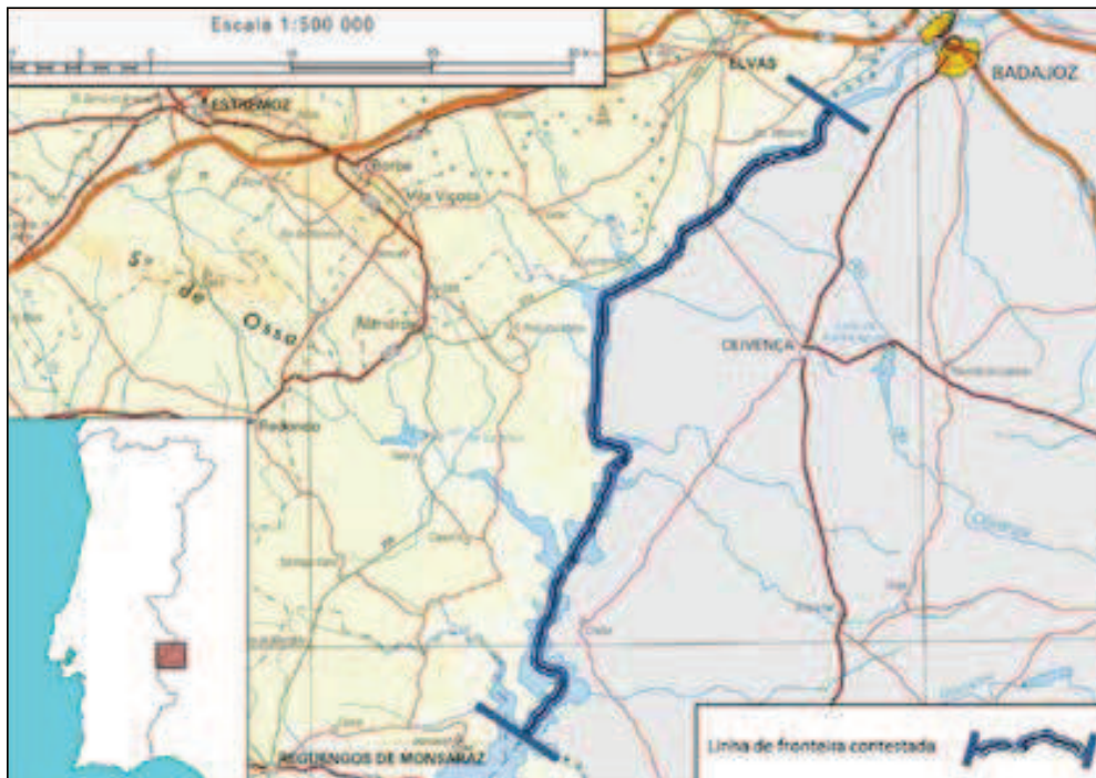
Figura 2 – Setor da fronteira terrestre contestado em virtude do conflito territorial de Olivença, localidade de origem portuguesa que se encontra sob soberania espanhola desde o início do século XIX. Na perspetiva de Portugal, trata-se de uma apropriação à revelia dos tratados internacionais.

A delimitação continental entre Portugal e Espanha resulta de uma sucessão de atos políticos e não de uma fronteira natural entre regiões biofísicas contrastadas. A raia luso-espanhola é obra da Geografia Humana e dos (des) equilíbrios estratégicos entre os dois países e não um produto da Geografia Física, apesar de a separação por vezes coincidir com alguns cursos de água. Significa isso que a fronteira foi pouco sensível ao suporte físico, daqui resultando dois Estados caracterizados pela diversidade paisagística interna mas também pela familiaridade espacial entre os dois lados dessa delimitação política.